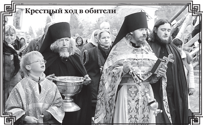
Крестный ход в обители