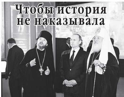
В Москве завершилась интерактивная выставка «Моя история. 1914 – 1945 гг. От великих потрясений к Великой Победе».

В сравнении с предыдущей экспозицией, интерес к проекту «Моя история. От великих потрясений к Великой Победе» оказался выше показателей прошлого года (выставка «Моя история. Рюриковичи» – 250 000 посетителей). Общая цифра посетителей за 218