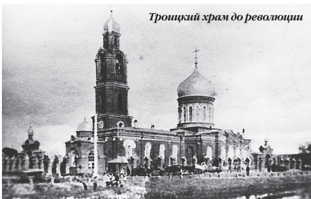
Троицкий храм до революции