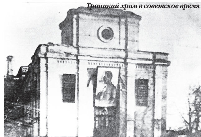
Троицкий храм в советское время