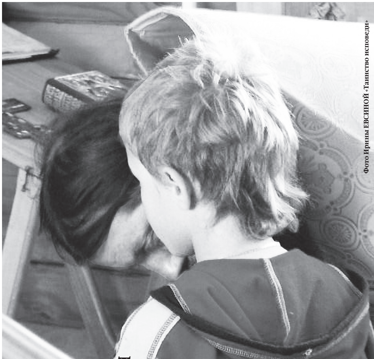
«Таинство исповеди»

Издается по благословению митрополита Рязанского и Михайловского Вениамина