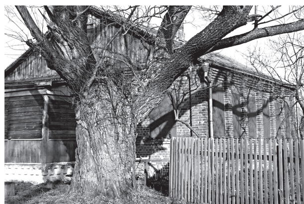
Дом Тарковского в д. Мясное