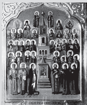
Икона Собора Рязанских святых

– Преподобный Серафим Саровский советовал стяжать дух мирен, а святитель Игнатий Брянчанинов свидетельствует, что это есть первый признак прикосновения к человеку благодати Святого Духа. Для стяжания благодати, хранения её и в том жизни с Богом и существуют в Церкви все эти средства: богослужение, личная молитва, пост, поклоны, и во всем и всегда – исполнение заповедей Божиих.