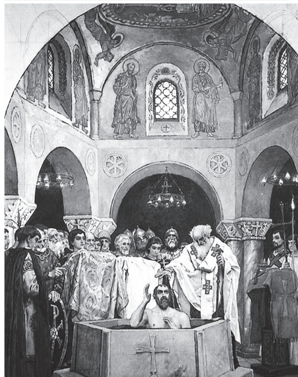
Виктор Васнецов. Крещение князя Владимира

Известно, что перед принятием крещения князь заболел глазной болезнью и ослеп. Случилось это после того, как он захватил греческий город Корсунь (последствия Херсонеса, а ныне Севастополь) и решил взять в жены сестру греческого императора Анну. При этом он пригрозил императору, что захватит и разграбит остальные греческие города, если Анну не получит. Но,