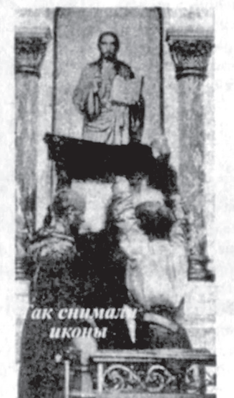
Как снимали иконы

— Раньше было очень страшно, это был настоящий страх, потому что я пережил смерти