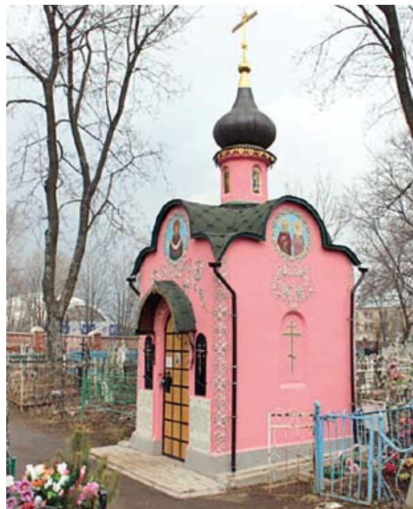
Часовня во имя святой блаженной Любви Рязанской на Скорбященском кладбище г. Рязани