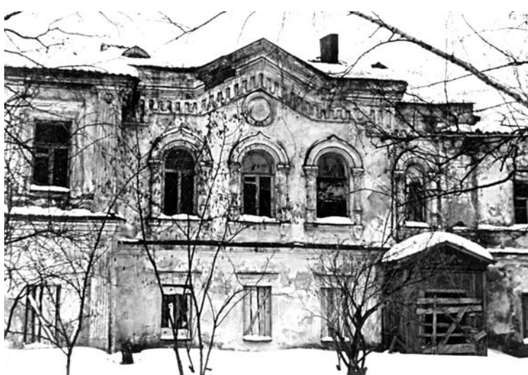
Вид Иоанно-Богословского храма в 1993 году