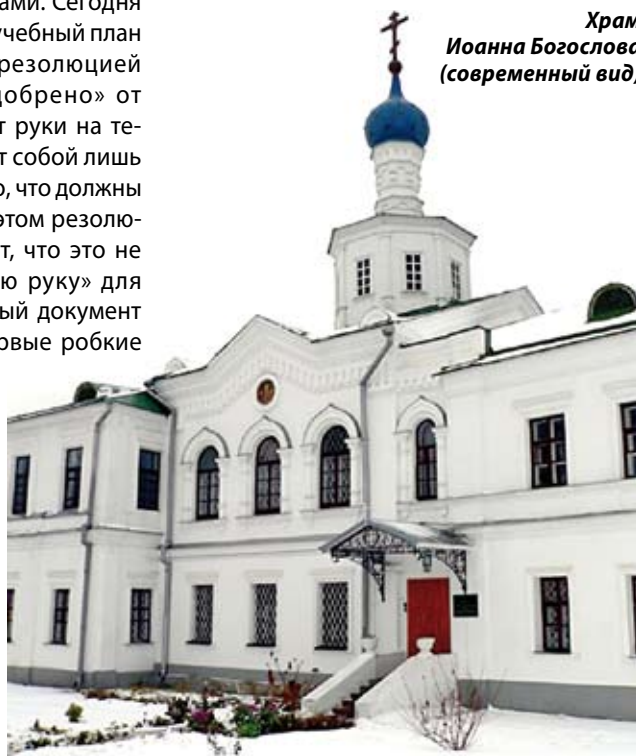
Храм Иоанна Богослова (современный вид)

Получив большое здание, училище получило и более широкие возможности (хотя и в этом здании они сегодня все равно ограничены). Однако здание в кремле было передано в аварийном состоянии: согласно акту приема-передачи, «полы прогнили, местами отсутствуют, стены –